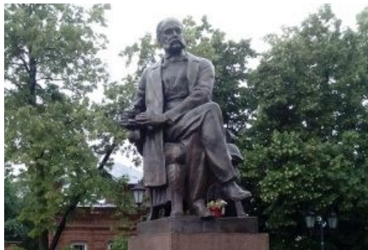
Памятник Гончарову на Родине

В родном городе писателя Ульяновске (ранее называемом Симбирск) находится Историко-мемориальный центр-музей имени И.А. Гончарова.