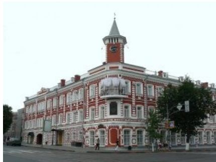
Музей Гончарова в Ульяновске

После выхода романа «Обрыв» писатель страдал от депрессии, писал уже мало, в основном этюды. Он был одинок и часто болел. 15 сентября 1891 года Ивана Гончарова не стало из-за воспаления лёгких.